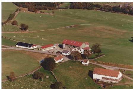
Steinsland bnr. 1 og 3 på slutten av 1980-tallet.