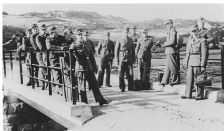
Folk fra Arbeidsleiren er på Steinslandbrua.